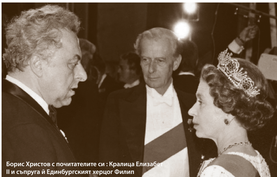
Борис Христов с почитателите си : Кралица Елизабет II и съпруга ѝ Единбургският херцог Филип

74-ия му рожден ден. Единствената възможност по онова време да се каже нещо беше „обаждане на слушател“ за няколко секунди. Нямах гаранция, че всеки, който иска, ще бъде включен, но аз имах късмет. Включиха ме и, посочвайки името си, професията си и родното си място, успех в трите цитирани изречения да заявя своята позиция. Цитатът е точен – не съм добавил или махнал нищо. Както тогава, така и днес мисля, че ние, българите, продължаваме да сме длъжници на великия бас!