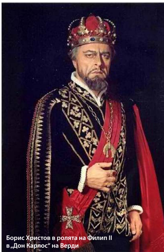
Борис Христов в ролята на Филип II в „Дон Карлос“ на Верди

На 18 май 2014 г. се навършиха 100 години от рождението на Борис Христов. Най-великият от великите! Юбилеят му се отбелязва в ООН и в много страни по света, които посвещават концерти и чествания на прочутия оперен певец. За българите той беше много повече от „Царят на басите“, аплодиран от цял свят. За нас той беше символ на „Изгубената България“, онази България, която по времето на съветския комунистически режим ни беше отнета и която Борис Христов ни връщаше. Нещо повече – той ни даваше възможност да се гордеем с една специфична „неразрешена“ гордост. След записите му в катедралата „Св. Александър Невски“ през 1976 г. неговото изпълнение на „Многая лета!“ се пускаше на плоча точно на Нова година от стотици хиляди, а може би и милиони българи, които искаха в негово лице да чуят своята България, а не словото на комунистическия диктатор!