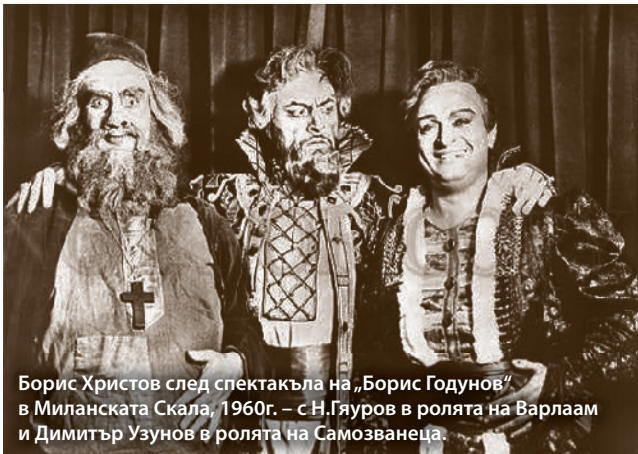
Борис Христов след спектакъла на „Борис Годунов“ в Миланската Скала, 1960г. – с Н.Гяуров в ролята на Варлаам и Димитър Узунов в ролята на Самозванеця.

инквизитор, започва дуета си с крал Филип II, превъплътен от Борис Христов мощно, като „йерихонска тръба“. Кралят в своите терзания как да накаже своя син Дон Карлос отговаря тихо до момента, когато инквизиторът предизвиква кралския гняв. „Non più frate!“ – Достатъчно, брате! („Брате“ е унизително обръщение към Великия инквизитор, който има титла и пр.) „Frate! troppo soffrii il tuo parlar crudel.“ (Брате, дълго слушах жестоките ти слова!) изригва гласът на Христов и „скрива“ начинаещия Гяуров. В края на дуета между двамата басы е прочутата фраза на краля „Докога тронът ще коленичи пред Олтара...“ с горното трудно достижи-мо за бас „фа“ и ниското долно „фа“. Една фраза – обхващаща две октави, т.е. преминаване през целия диапазон на баса. Борис Христов я изпълнява на един дъх! Публиката полудява от възторг. Христов триумфира отново! Завесата пада след многобройните поклони. Тогава прочутият бас прегръща младия Гяуров и му казва: „Не се мери с Христов! Той е само човек! Мери се с дядо Верди и с изкуството, защото са вечни!“ Царски жест, но за съжаление неоценен.