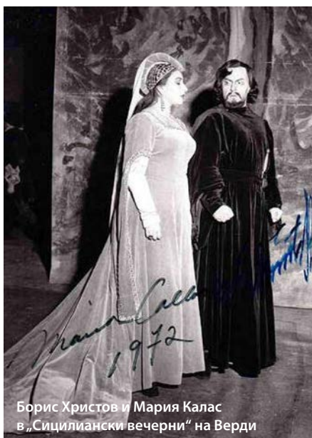
Борис Христов и Мария Калас в „Сицилиански вечерни“ на Верди

Вярно е, че накрая той беше удостоен със звание „народен артист“, но без да му се разреши да пее в страната си пред българската публика. Това ми напомня за австрийския паспорт на престолонаследника