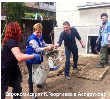
Еврокомисарят К.Георгиева в Аспарухово