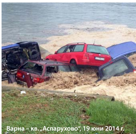
Варна – кв. „Аспарухово“, 19 юни 2014 г.