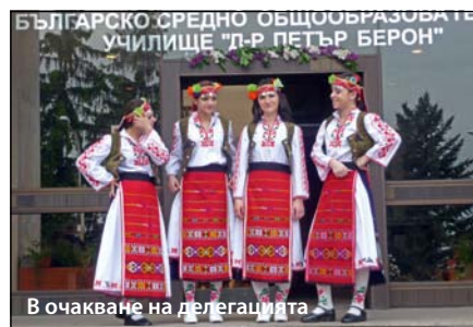
В очакване на делегацията

По традиция бе предаден Символът на знанието – изящна фигура на ангел, на 11 клас, които трябва да го съхранят и предадат на идващите след тях.