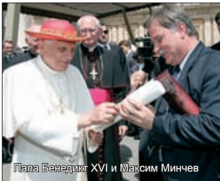
Папа Бенедикт XVI и Максим Минчев