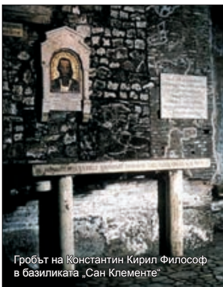
Гробът на Константин Кирил Философ в базиликата „Сан Клементе“