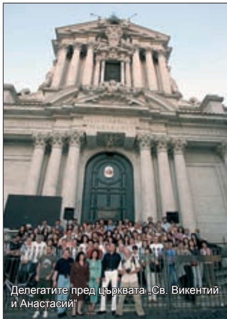
Делегатите пред църквата „Св. Викентий и Анастасий“